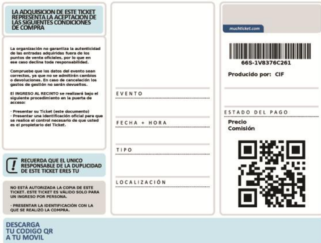
Imagen de tipo que visualizarás como PDF:

Cada vez que compres tus tickets a través del sitio www.principalticket.com vas a recibir los Tickets en tu mail para imprimirlos en tu impresora. Es muy sencillo, tan pronto como termines tu compra, recibirás un mail de confirmación de la compra y un archivo adjunto (PDF) para imprimir. Podrás imprimir tus tickets en el lugar en que te encuentres.